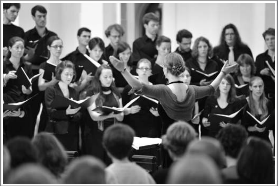
Neomania Ensemble Freiburg